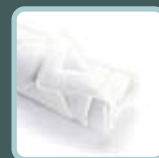
iSleep ® dekbed & kinderdekbed