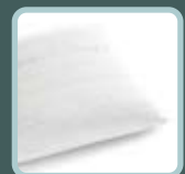
iSleep ® kussens