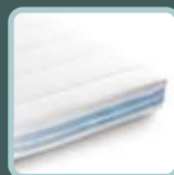
iSleep ® matras & kindermatras

Het iSleep ® -gamma omvat de volgende producten voor de beste bescherming: